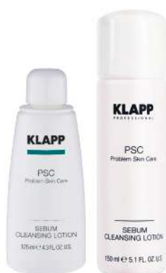
Sebum Cleansing Lotion

محصولات این لاین به طور ویژه برای پوست های بسیار چرب طراحی شده است. استفاده منظم از آن به وضوح بافت پوست را بهبود می بخشد، رنگ چهره شفاف و برق چربی پوست کمتر به نظر می رسد و ترشح پوست را کنترل می کند .