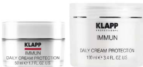
Daily Cream protection

محصولات این لاین برای تقویت سیستم دفاعی پوست طراحی شده است از آسیب های پوستی جلوگیری می کند. انعطاف پذیری طبیعی پوست های حساس را افزایش می دهد و با پیری زودرس مبارزه می کند.