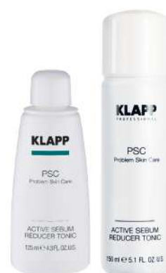
Active Sebum Reducer Tonic

لوسیون پاک کننده و تنظیم کننده چربی پوست، کنترل روزانه ها، تنظیم PH پوست و بر پایه آب