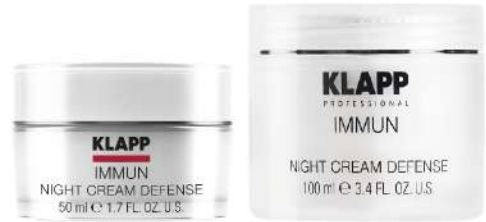
Night Cream Defense

کرم رطوبت رسان ویژه پوست های خشک و کم آب، مواد موثر این محصول سیستم دفاعی پوست را تقویت کرده، از التهاب و حساسیت آن کاسته و از پیری زودرس جلوگیری می کند