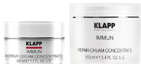
Repair Cream Concentrate

ماسک کرمی که مکانیسم های دفاعی پوست های تحریک شده و ملتهب را تقویت می کند