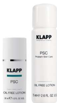
Oil Free Lotion

تونر پوست چرب، این محلول حاوی مواد موثر الاتونین، سولفور، بیوتین می باشد که پاک کننده آلودگی هاست و ترشح بیش از حد سبوم پوست را کنترل می کند این محصول به علت ریز مولکول بودن عمق نفوذ بالایی دارد