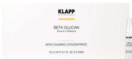
Skin Calming concentrate

ماسک کرمی غنی برای استفاده در سالن، چربی های مفید را برای بازگرداندن تعادل سد طبیعی پوست فراهم میکند