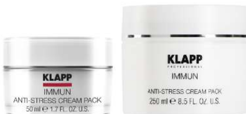
Anti-Stress Cream Pack

کرم شب سبک با قابلیت رطوبت رسانی بالا و بازسازی کننده که سد دفاعی پوست را تقویت می کند و مناسب پوست های خشک و حساس است